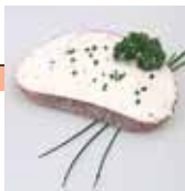
Frischkäse auf Brot